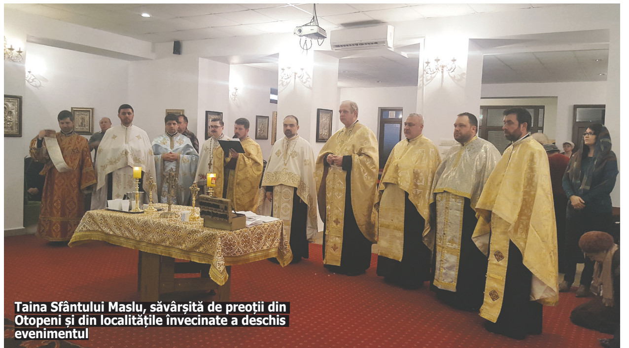
Taina Sfântului Maslu, săvârșită de preoții din Otopeni și din localitățile învecinate a deschis evenimentul

Prin abordarea temei „Sfintele icoane în cultul ortodox”, părintele Ion Iliuță a reușit să ducă rugătorii cu gândul că icoanele ridică omul din lumea concretă. După o scurtă incursiune în istoria Bisericii și a poporului român în timpul prigoanei declanșate de comuniști