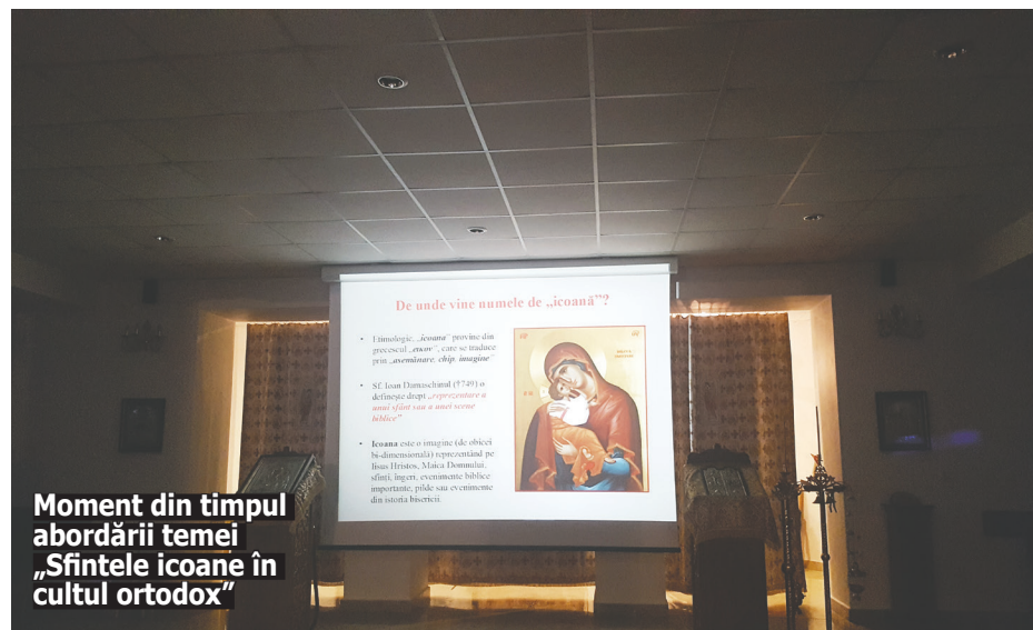
Moment din timpul abordării temei „Sfintele icoane în cultul ortodox”

În mod special, părintele protopop a scos în evidență bucuria din care