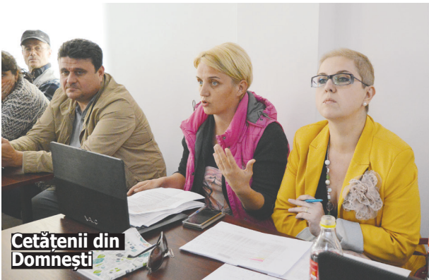
Cetățenii din Domnești