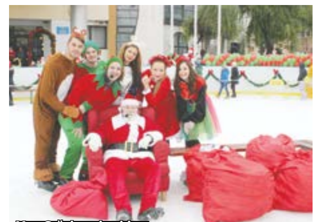
Moș Crăciun și echipa lui de spiriduși