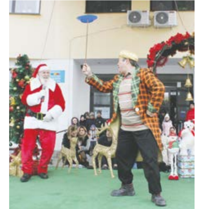
Petrecerea continuă în noaptea de Revelion