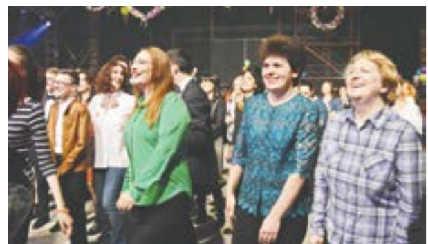
Edilul din Buftea a dansat alături de sărbătorite

Doamnele și domnișoarele din Buftea au fost invitate să petreacă de ziua lor, vineri, 9 martie, în incinta Bucharest Film Studios – Mediapro, fiind întâmpinate de primarul Gheorghe Pistol și de mai mulți domni eleganti, cu trandafiri și felicitări. Invitatele au fost apoi conduse spre zona de petrecere, special amenajată cu mii de baloane colorate și flori, într-o temă veselă, de primăvară. Totul a fost de altfel organizat până la cel mai mic detaliu, astfel încât toată lumea să se simtă extraordinar de bine, să se distreze, să se relaxeze și să nu uite această petrecere cel puțin un an, până