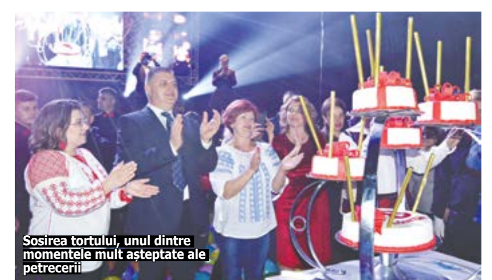
Sosirea tortului, unul dintre momentele mult așteptate ale petrecerii