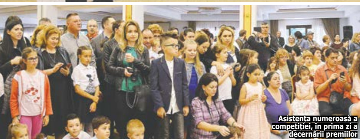
Asistența numeroasă a competiției, în prima zi a decernării premiilor

Buftea a devenit un amfiteatru al simfoniei artelor. Fie ele muzicale, de teatru sau pictură, coregrafie sau de idei literare, atletice ori lirice și încă altele. Cel mai recent, timp de două zile, 19 și 20 mai, peste 300 de preșcolari și elevi - cu vârste de la 4 la 18 ani - și-au demonstrat calitățile de muzicieni instrumentiști în competiția tradițională intitulată „Sonoris”. A fost a V-a ediție a Concursului național de interpretare pentru pian, la care au participat copii și tineri din localități ilfovene, Municipiul București, plus alte șase județe ale țării: Argeș, Cluj, Dâmbovița, Galați, Giurgiu și Prahova. Orașul amfitrion i-a primit ospitalier pe invitați - interpreți, specialiști, profesori îndrumători și părinți.