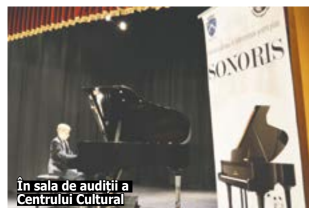
În sala de audiii a Centrului Cultural