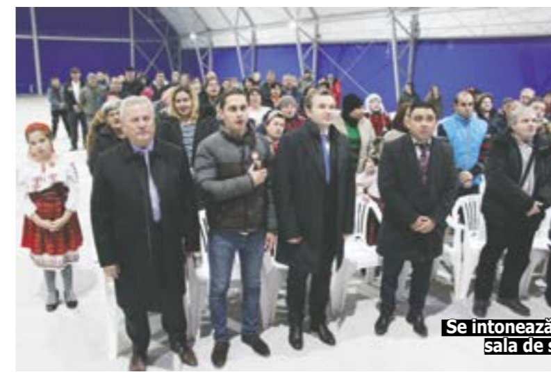
Se intonează Imnul Național, în sala de sport din Lipia