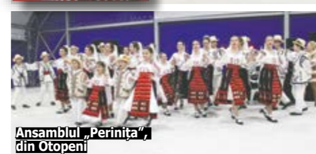
Ansamblul „Perinița”, din Otopeni