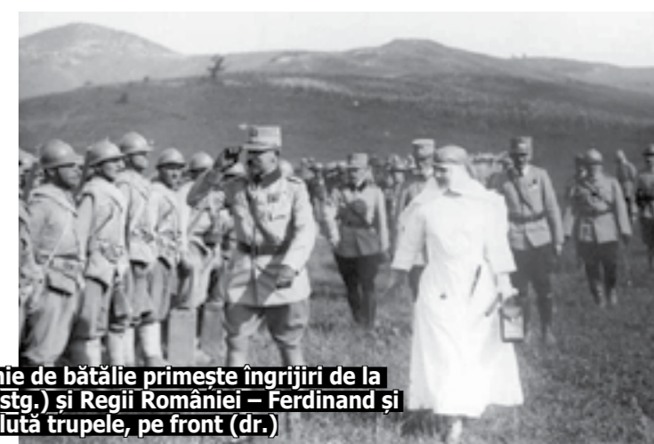
Un rănit în prima linie de bătaie primește îngrijiri de la sanitarul companiei (Stg.) și Regii României - Ferdinand și Maria - salută trupele, pe front (dr.)