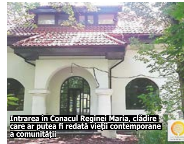
Întrearea în Conacul Reginei Maria, clădire care ar putea fi redată vieții contemporane a comunității

căi de rezolvare. Ar trebui să îl putem reda vieții contemporane în cea mai utilă variantă. Până la urmă, fosta casă de oas-