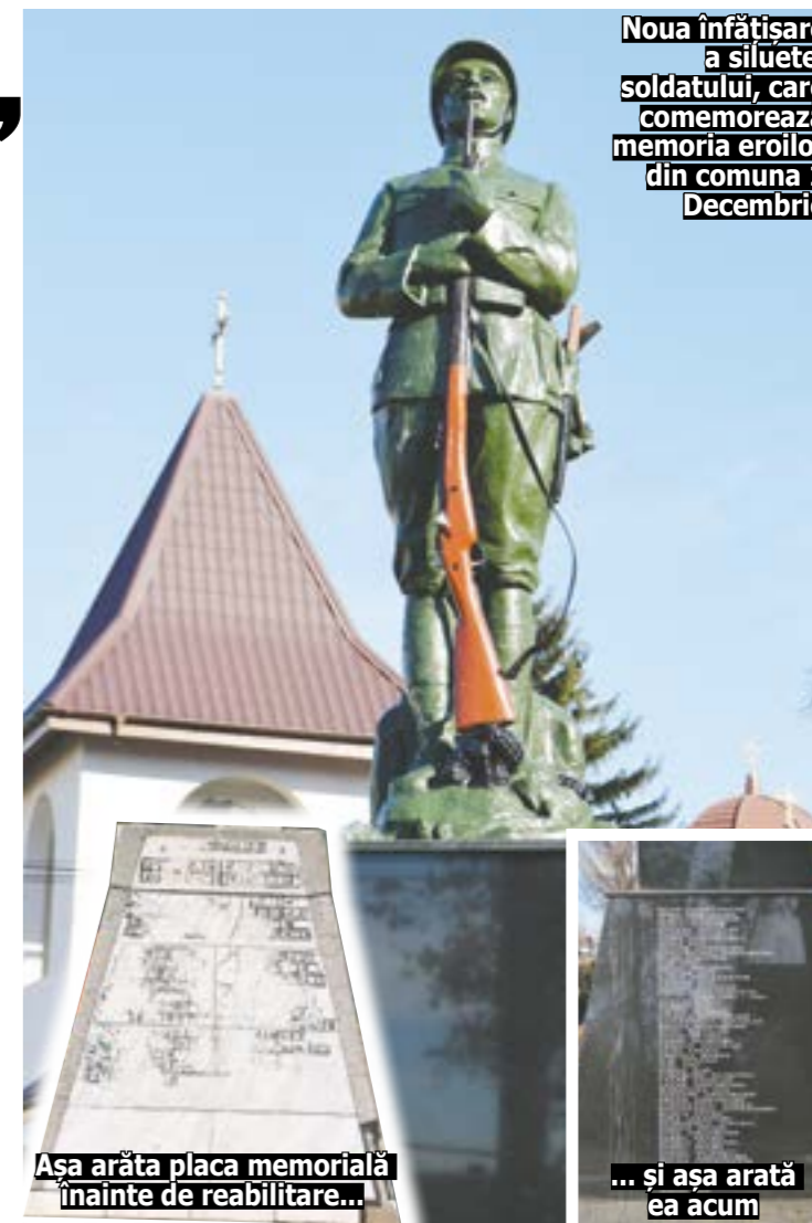
Noua înfățișare a siluetei soldatului, care comemorează memoria eroilor din comuna 1 Decembrie