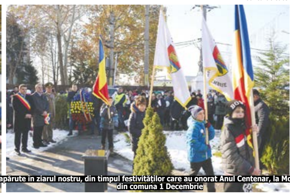
Imagini apărute în ziarul nostru, din timpul festivităților care au onorat Anul Centenar, la Monumentul Eroilor din comuna 1 Decembrie