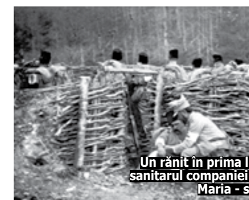
Un rănit în prima linie de bătaie primește îngrijiri de la sanitarul companiei (Stg.) și Regii României - Ferdinand și Maria - salută trupele, pe front (dr.)

De la același interlocutor am mai aflat că pentru aniversarea de la 1 Decembrie și-ar fi dorit să amplaseze în fața primăriei două busturi, ale Regelui Ferdinand și Reginei Maria. „Ele ar fi făcut și legătura cu istoria concretă a comunei noastre. Până la urmă, acești suverani au avut o mare contribuție în momentele istorice ale devenirii și transformărilor țării. Poate vreodată, cu acordul cetățenilor și a forurilor în drept, comuna noastră să își schimbe numele cu al unuia dintre aceste personalități. Poate... vreodată, cine știe? Apoi, în trecut, comuna noastră chiar s-a numit «Regele Ferdinand». Iar Regina Maria a avut un conac, un domeniul regal pe care l-a iubit mult. Mă gândesc să vedem cum poate fi răs-