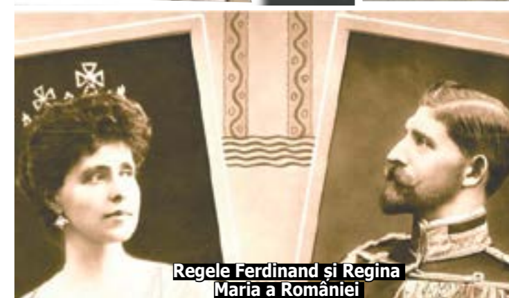
Regele Ferdinand și Regina Maria a României