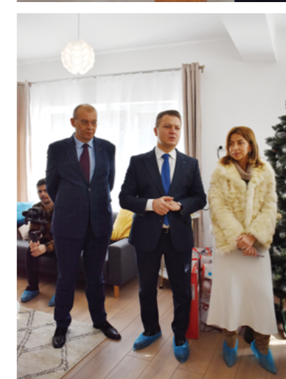
Casa a fost construită

cu sprijinul Asociației Investitorilor de Real Estate din România (AREI) și