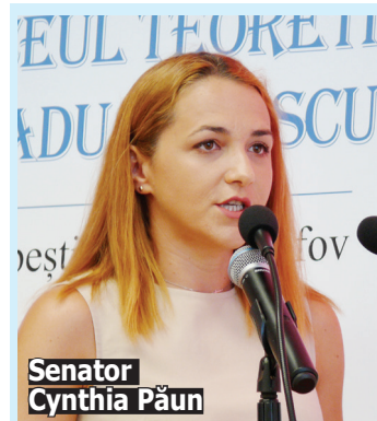
Senator Cynthia Păun

Dumitru Văduva a mulțumit ilfovenilor "pentru fiecare din cele peste 40.000 de voturi. Sunt plin de recunoștință! Vă asigur ca voi face tot ceea ce îmi stă în putere să vă reprezint cu cinste în Parlamentul României", a comentat acesta, adăugând că "prioritățile mele legislative sunt educația, infrastructura, sănătatea, cu accent pe calitatea aerului în București și în Ilfov. Calitatea actului de guvernare și de legiferare trebuie crescută. Doar printr-o politică orientată spre nevoile și așteptările cetățeanului putem crește încrederea cetățeanului în instituțiile statului".