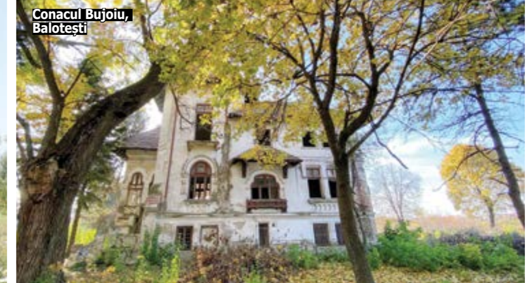
Conacul Bujoiu, Balotești

comparativ cu anul 2015 - când s-au predate DJC Ilfov - doar 5 bunuri culturale descoperite întâmplător. În anul 2022, au fost predate Direcției Județene de Cultură Ilfov 394 de bunuri culturale descoperite întâmplător, iar în 2024 - numărul acestora a fost de 232.