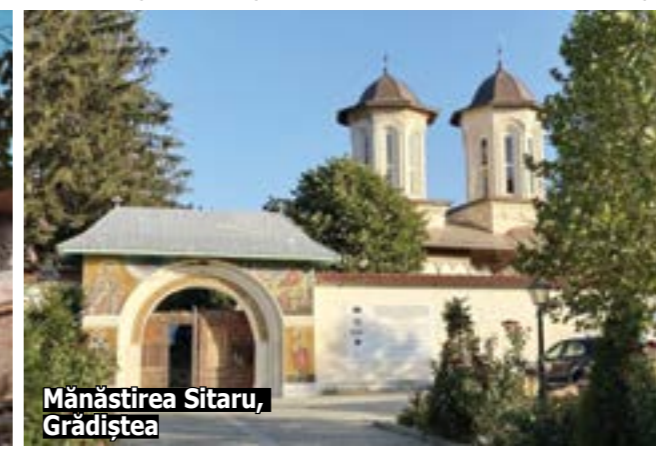
Mănăstirea Sitaru, Grădiște

tinuare, precară, dat fiind că până de curând instituția a funcționat pe stare de avarie; iar impedimente de natură legislativă au făcut ca instituția să nu poată accesa doțările corespunzătoare în 2023-2024, astfel că directorul și cei trei consilieri care își desfășoară activitatea în compartimentele Patrimoniu mobil și imaterial și Monumente istorice și arheologie să folosească laptop-urile personale. Abia în anul 2024 a fost întocmit Nomenclatorul arhivistic și s-a demarat, cu ajutorul unei firme de specialitate, organizarea acestuia. În organigrama DJC Ilfov sunt 7 posturi alocate și finanțate, grupate și ocupate astfel: director execu-