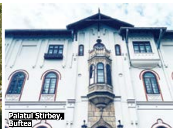
Palatul Știrbey, Buftea

În activitatea de evidență a patrimoniului construit s-a menționat realizarea unei situații de prezență/absență fișei