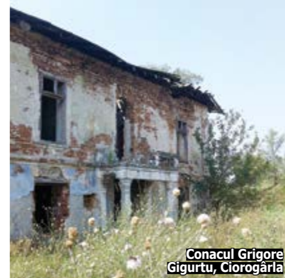
Conacul Grigore Gigurtu, Ciorogârla

În continuare, aceasta s-a referit și la descoperirile arheologice întâmplătoare de pe raza județului Ilfov, numărul acestora fiind în creștere, în timp,