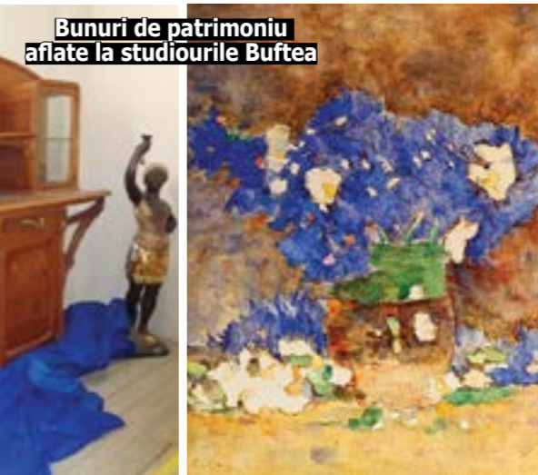
Bunuri de patrimoniu aflate la studiourile Buftea

tinuare, precară, dat fiind că până de curând instituția a funcționat pe stare de avarie; iar impedimente de natură legislativă au făcut ca instituția să nu poată accesa doțările corespunzătoare în 2023-2024, astfel că directorul și cei trei consilieri care își desfășoară activitatea în compartimentele Patrimoniu mobil și imaterial și Monumente istorice și arheologie să folosească laptop-urile personale. Abia în anul 2024 a fost întocmit Nomenclatorul arhivistic și s-a demarat, cu ajutorul unei firme de specialitate, organizarea acestuia. În organigrama DJC Ilfov sunt 7 posturi alocate și finanțate, grupate și ocupate astfel: director execu-