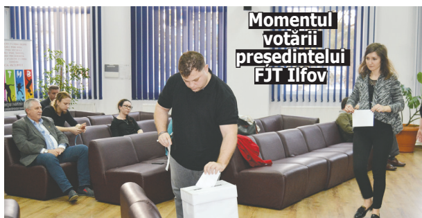
Momentul votării președintelui FJT Ilfov