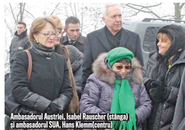
Ambasadorul Austriei, Isabel Rauscher (stânga) și ambasadorul SUA, Hans Klemm (centru)

Au fost prezenți și reprezentanți ai corpului diplomatic în România, ambasadorul SUA, Hans Klemm și ambasadorul Austriei, Isabel Rauscher. Cu această ocazie, Aurel Vainer, președintele Federației Comunităților Evreiești din România și primarul comunei Jilava, au dezvelit o placă comemorativă pe locul în care urmează să se ridice un monument în memoria victimelor masacrului din 22