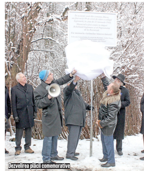
Dezvelirea plăcii comemorative