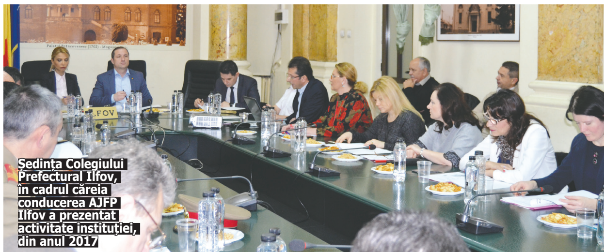
Sedința Colegiului Prefectural Ilfov, în cadrul căreia conducerea AJFP Ilfov a prezentat activitatea instituției, din anul 2017

S-au gestionat 481.246 formulare (declarații de impozite, taxe și contribuții, declarații privind impozitul pe venit sau declarații informative) - depuse electronic: 455.224. S-au emis 19.423 decizii de impunere pentru plăți (din care decizii de impunere anuală: 8.400; iar din acestea, cu sume de restituit: 2.034); 2.315 certificate