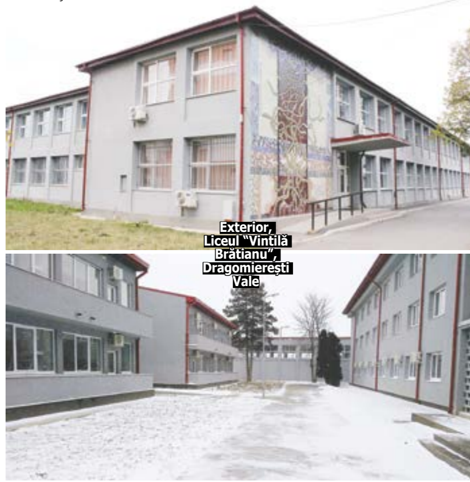
Exterior, Liceul "Vintilă Brătianu", Dragomirești Vale