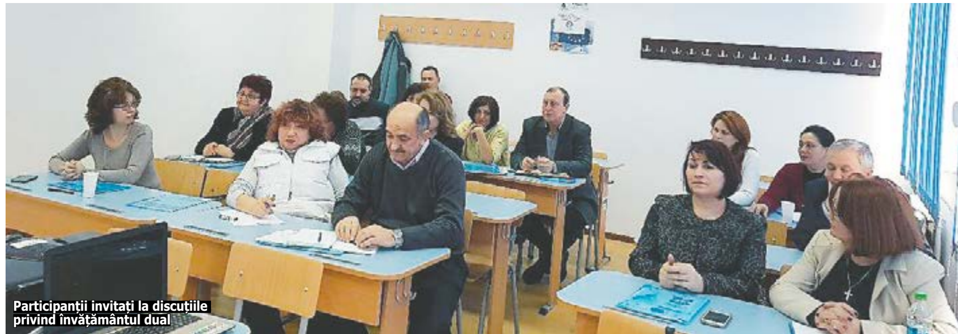
Participanții invitați la discuțiile privind învățământul dual