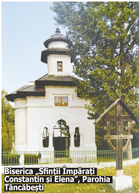
Biserica „Sfintii Împărați Constantin și Elena”, Parohia Tâncăbești