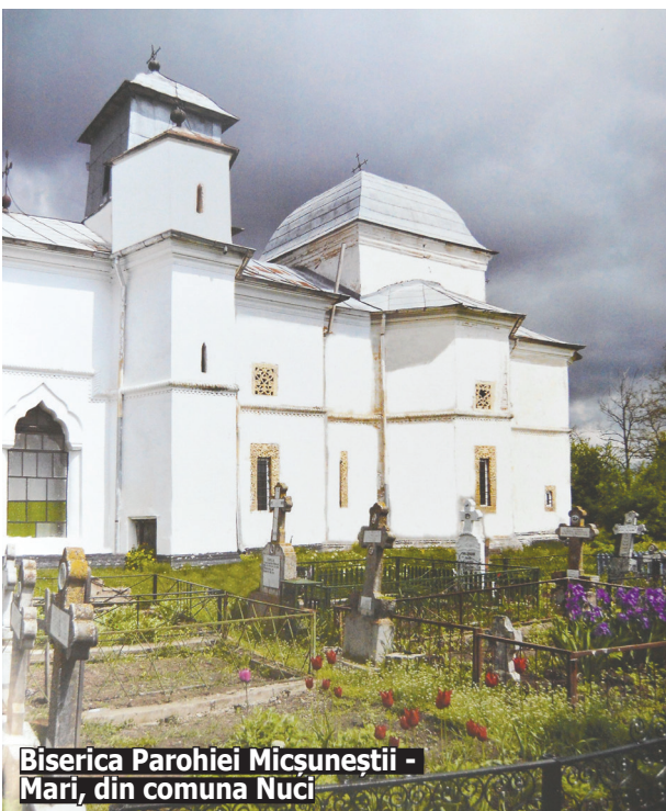
Biserica Parohiei Micșuneștii - Mari, din comuna Nuci

„Nu poate să fie întâmplător că după fix 7 ani (cifra magică a Lui Dumnezeu) de la emiterea ultimului Ordin de constatare a dreptului de proprietate (OP 146/23.03.2011, semnat de prefectul județului Ilfov la acea vreme - Dan Cornel Baranga, privind constatarea dreptului de proprietate privată pentru terenul în suprafață de 3.579 mp, situat în comuna Gruuiu, satul Siliștea Snagovului, al Parohiei Siliștea Snagovului - Biserica „Sf. Nicolae”) au fost emise, primele cinci acte administrative care constată dreptul de proprietate privată asupra tere-