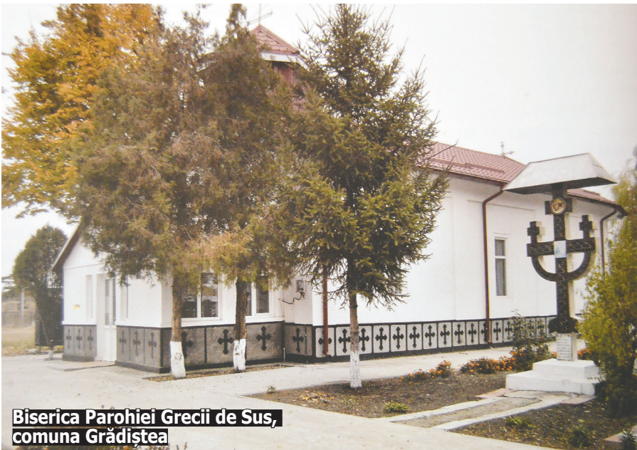
Biserica Parohiei Grecii de Sus, comuna Grădiștea

La Prefectura Ilfov, s-a reluat procesul de constatare a dreptului de proprietate pentru terenurile lăcașurilor de cult