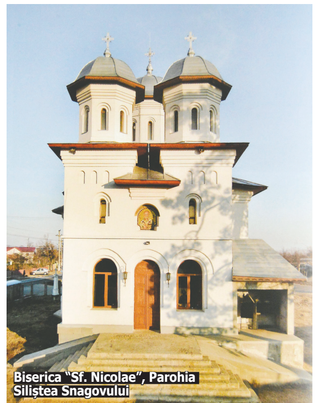
Biserica „Sf. Nicolae”, Parohia Siliștea Snagovului

În acest moment, potrivit prefectului, alte 16 parohii din Ilfov pregătesc dosarele pentru depunerea la comisie, în vederea obținerii titlurilor de proprietate, iar această deblocare a procedurii a creat, de fapt, condițiile necesare protejării acestor lăcașuri de cult din Ilfov. Acum se pot accesa fonduri pentru reabilitarea celor deteriorate, sau se pot renova.