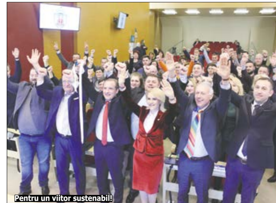
Pentru un viitor sustenabil!

În luna februarie, Consiliul General al Municipiului București (CGMB) a aprobat folosirea terenului bazei RATB din Șos. Pipera 55, sector 2, pentru construirea "Spitalului Metropolitan". Acesta ar urma să aibă circa 1.200 paturi, cu pondere mare pentru secțiile în care acum există în spitalele Capitalei deficit de paturi