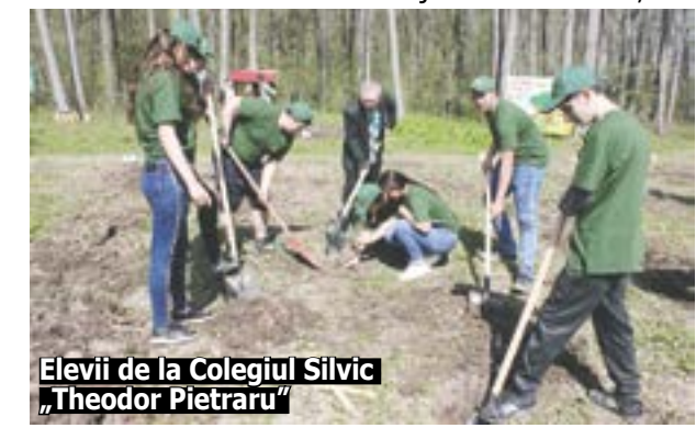
Elevii de la Colegiul Silvic „Theodor Pietraru”