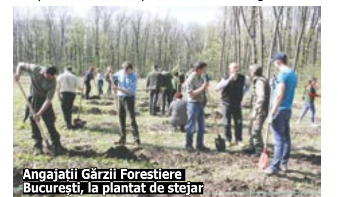
Angajații Gărzii Forestiere București, la plantat de stejar