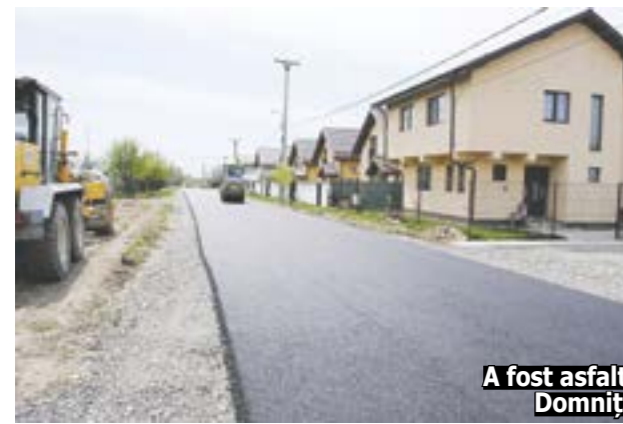
A fost asfaltată strada Domnița Ralu