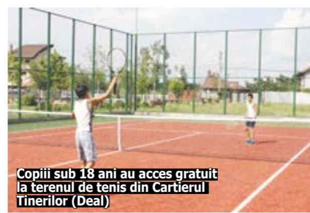
Copiii sub 18 ani au acces gratuit la terenul de tenis din Cartierul Tinerilor (Deal)

„Terenul vine ca o completare a parcului deja amenajat în această zonă, creând astfel un spațiu excelent de agrement în care cei mici, dar și cei mari, pot face mișcare sau se pot plimba în aer liber în condiții optime. El constituie pentru noi un real succes în domeniul, pentru că, deja, copiii sunt încântați să joace tenis, iar noi le pu-