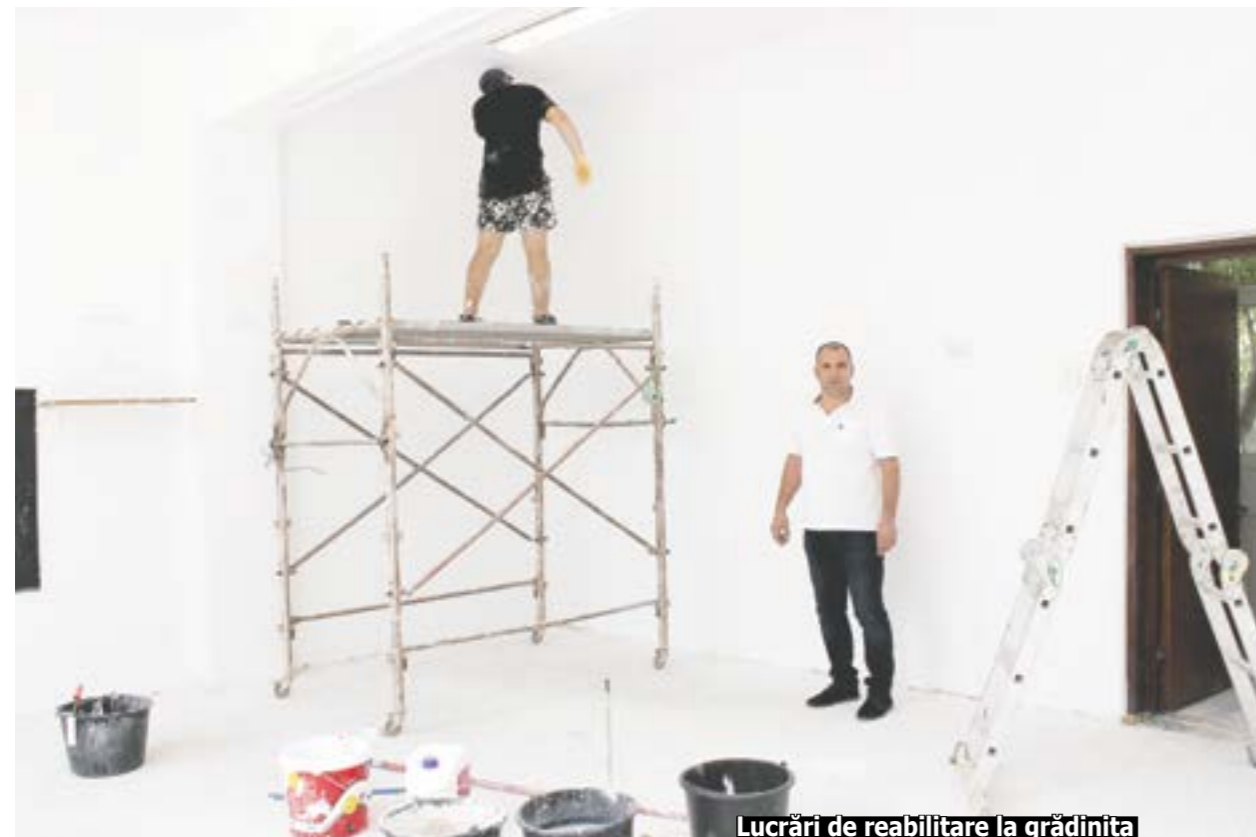
Lucrări de reabilitare la grădinița din Ograda Ștefănești

Cine vizitează comuna Afumați poate constata că această așezare cunoaște, aproape zilnic, transformări edilitare benefice pentru locuitorii săi. Fie că vorbim de modernizarea străzilor, fie de apă și canalizare, de parcuri sau infrastructură școlară, ceva se schimbă în bine aici, în cetatea voievodului Radu de la Afumați. Și nimeni nu poate nega că toate acestea se întâmplă din „vina” echipei de la primărie, a Consiliului local și, nu în ultimul rând, a primarului Gabriel Dumănică.