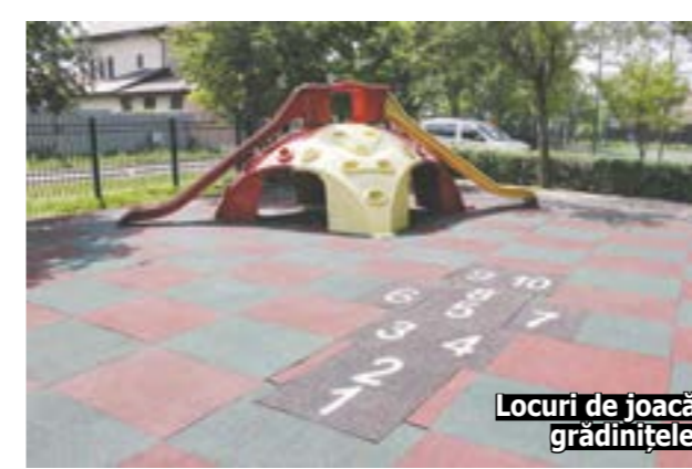
Locuri de joacă modernizate, la grădinițele din Afumați

Odată cu sfârșitul anului școlar, primăria a demarat o serie de lucrări de reabilitare și igienizare a școlilor și grădinițelor din Afumați. În acest moment se lucrează la grădinița aflată în aceeași clădire cu școala din Ograda Ștefănești. „Așadar, acum se reabilitează jumătate din clădire. Vor fi schimbate parchetul, lambriurile, pereții vor fi curățați de vechea zugrăveală și vor fi igienizați, se vor efectua reparații la grupurile sanitare și se vor aduce vase de toale-