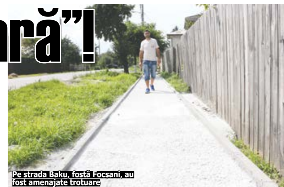
Pe strada Baku, fostă Focșani, au fost amenajate trotuare

(„ICIL”). Lucrările au constat în înlocuirea nisipului existent până atunci cu un produs antitraumă din cauciuc tartanic, un material cunoscut pentru elasticitatea sa, care atenuază foarte eficient impactul și, totodată, au fost înlocuite/completate cu aparatură de joacă nouă.