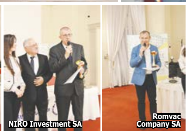
NIRO Investment SA