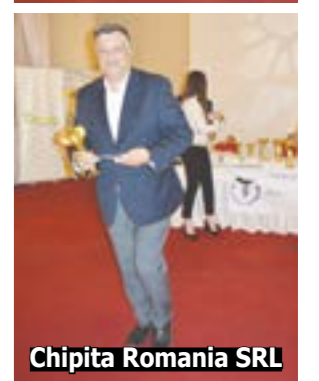
Chipita Romania SRL

fov a început festivitatea de premiere a companiilor care au obținut cele mai bune rezultate în domeniul afacerilor în anul 2017.