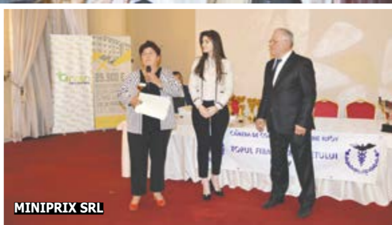
Romvac Company SA MINIPRIX SRL