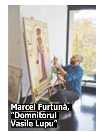
Marcel Furtună, „Domnitorul Vasile Lupu”