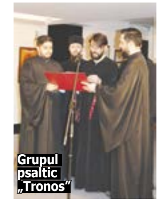
Grupul psaltic „Tronos”