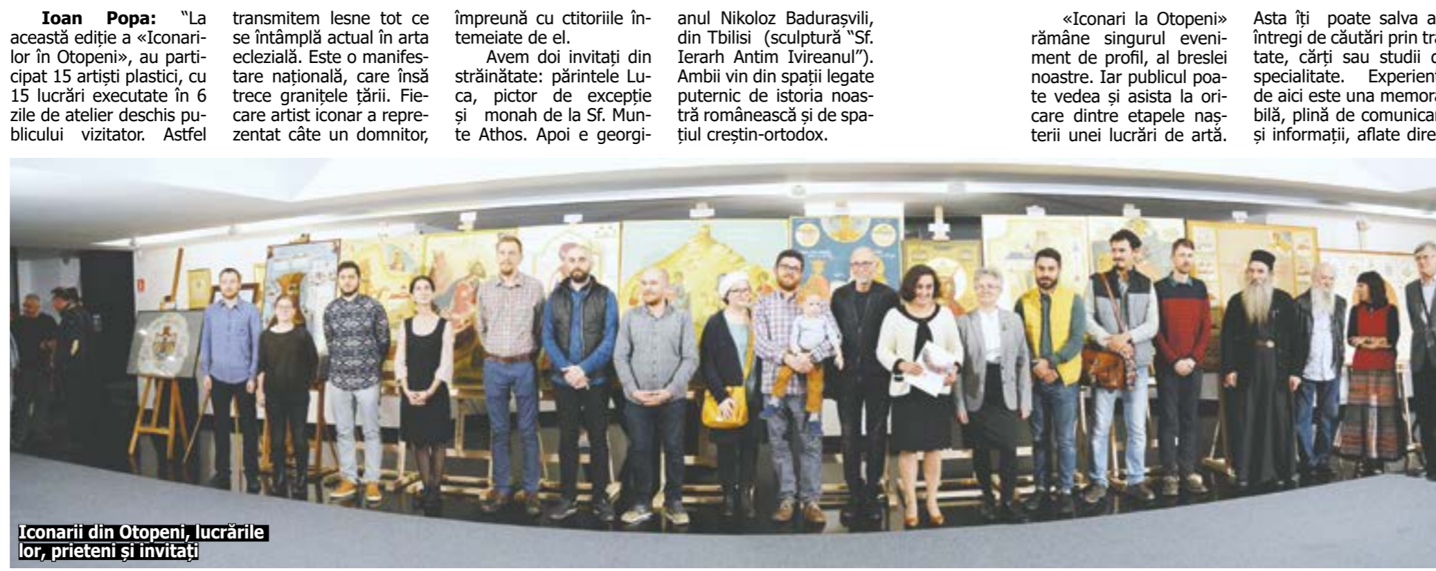
Iconarii din Otopeni, lucrările lor, prietenii și invitați