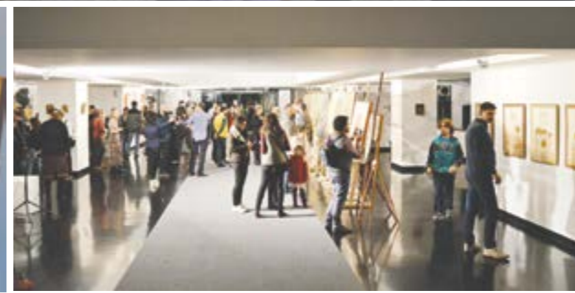
Moment din timpul vernisajului expoziției