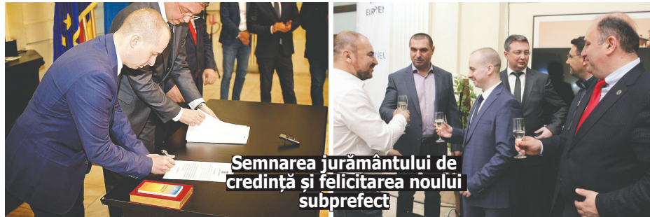
Semnarea jurământului de credință și felicitarea noului subprefect

Vincentiu Voicu pentru investire. Este o persoană pe care o cunosc și, de aceea, sunt sigur că echipa aceasta va funcționa bine și va respecta litera și spiritul legii. Bine ai venit, domnule subprefect, în echipă! Avem mult de muncă, așa că... la treabă!", a spus, la rândul său, prefectul Mihai-Sandu Niță.