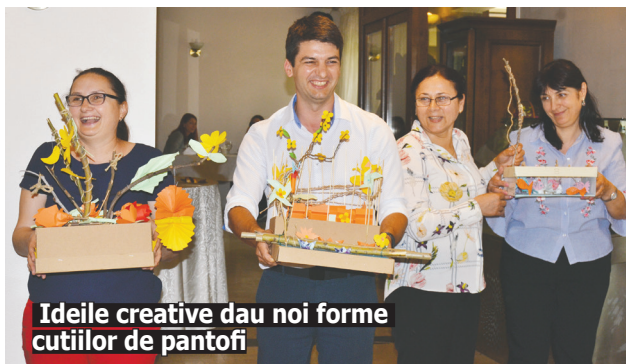
Ideile creative dau noi forme cutiilor de pantofi