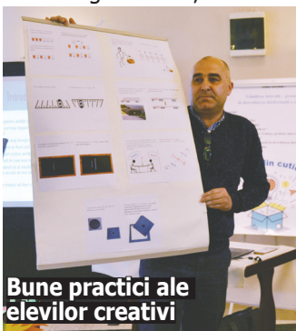
Bune practici ale elevilor creativi