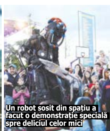
Un robot sosit din spațiu a făcut o demonstrație specială spre deliciul celor mici