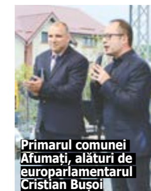
Primarul comunei Afumați, alături de europarlamentarul Cristian Bușoi

urcat o mulțime de artiști renumiți ce au reprezentat cu onoare toate genurile muzicale. Edilul a urcat pe scena din Afumați și în cea de a doua zi a petrecerii și a mulțumit tuturor celor care au ajutat la organizarea evenimentului. "Am ajuns la ediția a 11-a a comunei Afumați, o ediție despre care putem spune că este una dintre cele mai reușite. Acest lucru întâmplându-se datorită prezenței dumneavoastră. Vă mulțumesc. Putem spune că la această ediție avem cei mai mulți oaspeți de seamă. Nu numai cetățenii din comuna noastră, Petrăchioaia, Găneasa, primarul comunei Petrăchioaia, oaspeți din Ștefănești, Voluntari, bucureșteni