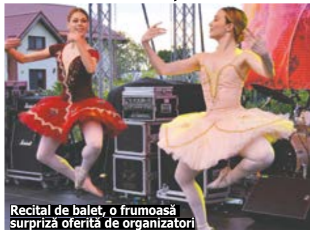
Recital de balet, o frumoasă surpriză oferită de organizatori