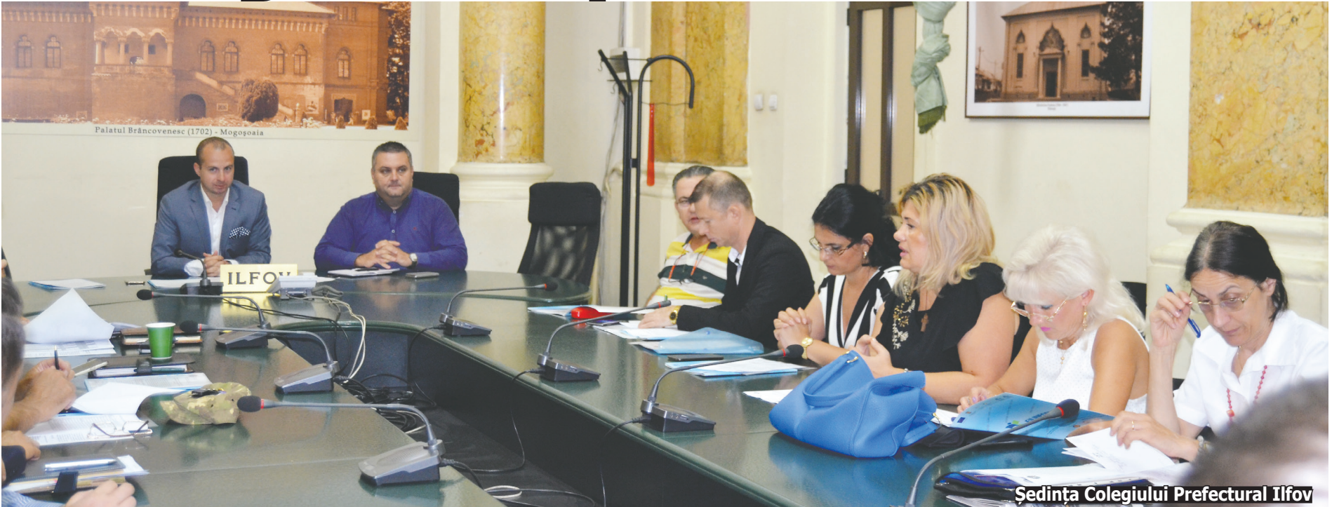
Sedința Colegiului Prefectural Ilfov

Sute de decizii pentru acordarea venitului minim garantat (VMG) urmează să fie suspendate în Ilfov, pentru că beneficiarii au fost identificați că realizează venituri suplimentare din jocuri de noroc! Potrivit informării privind evoluția numărului de beneficiari de asistență socială și a plăților aferente la nivelul județului Ilfov, în semestrul 1 al anului 2019, prezentată în cadrul celei mai recente reuniuni a Colegiului Prefectural, la finele anului trecut numărul mediu de beneficiari de VMG a fost, pentru Ilfov, de 1.325, iar la 30 iunie 2019, de 1.107 persoane. Totalul plăților pentru VMG a fost, la sfârșitul primului semestru al anului în curs, de 1.704.847 lei.