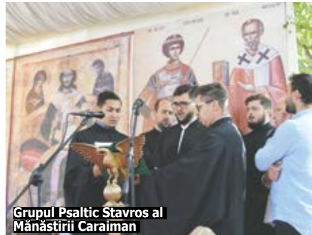
Grupul Psaltic Stavros al Mănăstirii Caraiman