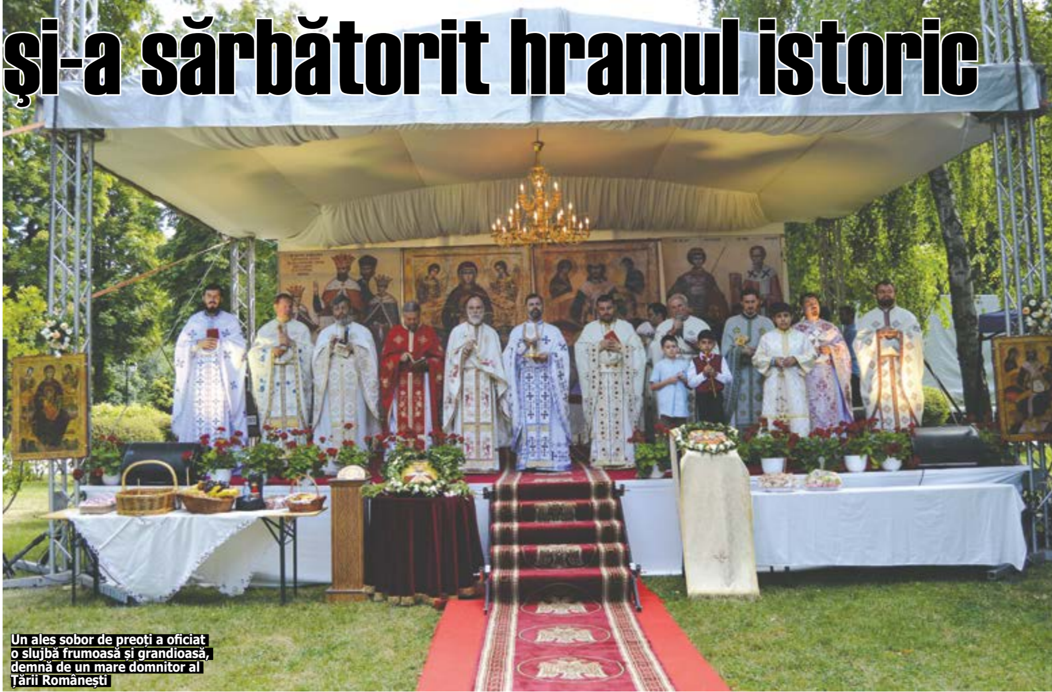
Un ales sobor de preoți a oficiat o slujbă frumoasă și grandioasă, demnă de un mare domnitor al Țării Românești