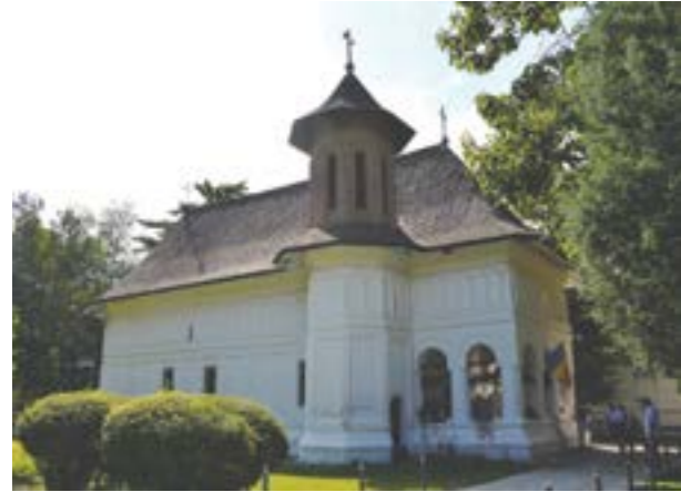
Pelerinaj la Mogoșoaia