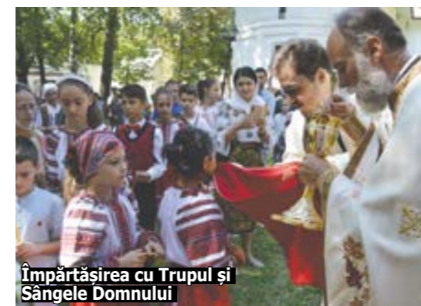
Împărțirea cu Trupul și Sângele Domnului