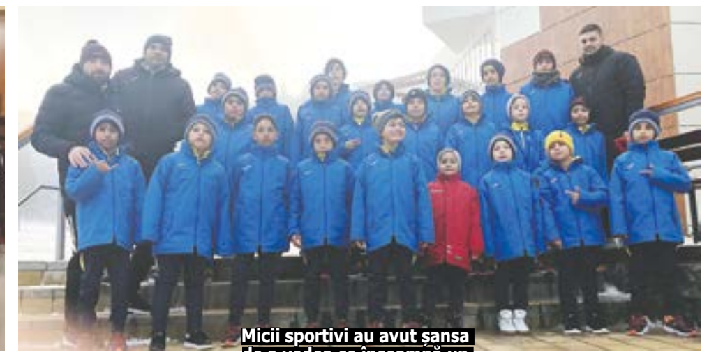
Micii sportivi au avut șansa de a vedea ce înseamnă un cantonament profesionist de fotbal, în Poiana Brașov.