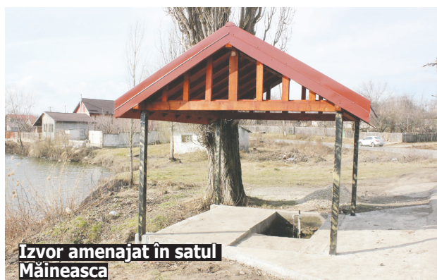
Izvor amenajat în satul Măineasca

cu alei de intrare în curte, adică podețe de acces, cât și cu șanțuri de pământ. Banii provin în proporție de 90% de la CJ Ilfov, iar diferența de 10% este asigurată de la Consiliul Local, suma totală necesară acestei investiții ajungând la