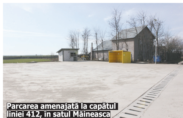
Parcarea amenajată la capătul liniei 412, în satul Măineasca

tant este legat de transportul public. "Am început amenajarea capului de linie 412, sat Măineasca. Amenajăm cabina de odihnă a șoferilor, cu toaletă, duș, puț cu hidrofor, cu iluminat și cu împrejmuire. Din cauza vremii, am fost nevoiți să ne