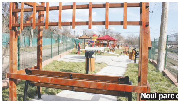
Noul parc din satul Măineasca